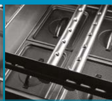
Bras de lavage