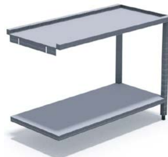
Table de sortie pour capot ●

Table lisse en acier inoxydable pour laveuse à capot.