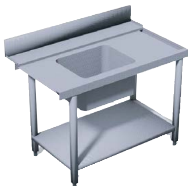
Table d'entrée droite ●

Pour modèles LKRHOOD-LKRRK. Table avec bac 500x400x270mm, 4 pieds, Accrochée à droite de la machine.