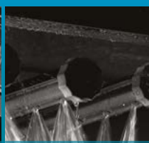
Zone de lavage