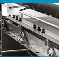
Économiseur lavage et rinçage