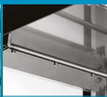
Bras de rinçage