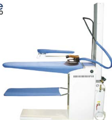
Table de repassage autonome ●

Plateau universel aspirant/chauffant Fer électrovaporisant avec semelle téflon Chaudière inox 5,8 litres Puissance chaudière 1,7 kW Réserve externe 20 litres Remplissage automatique à partir de la réserve En accessoires : jeannette, bras d'éclairage + néon LED, suspension fer